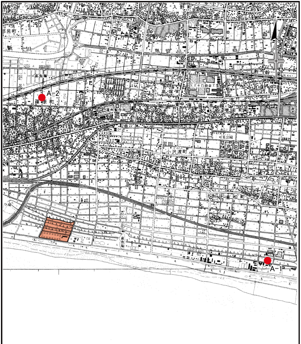
図3.1 大気質調査地点