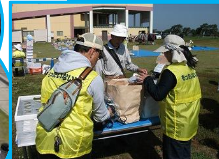
ご利用者の皆様へのお願い