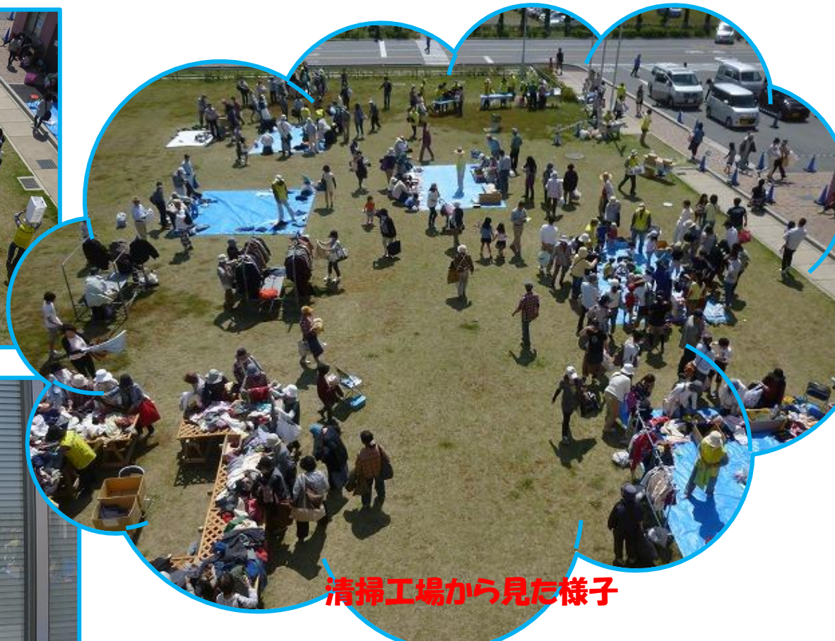
清掃工場から見た様子