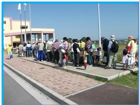
開催前に並ばれた方 65名