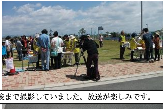
今回は、浜松市広報課のTV取材があり、最後まで撮影していました。放送が楽しみです。