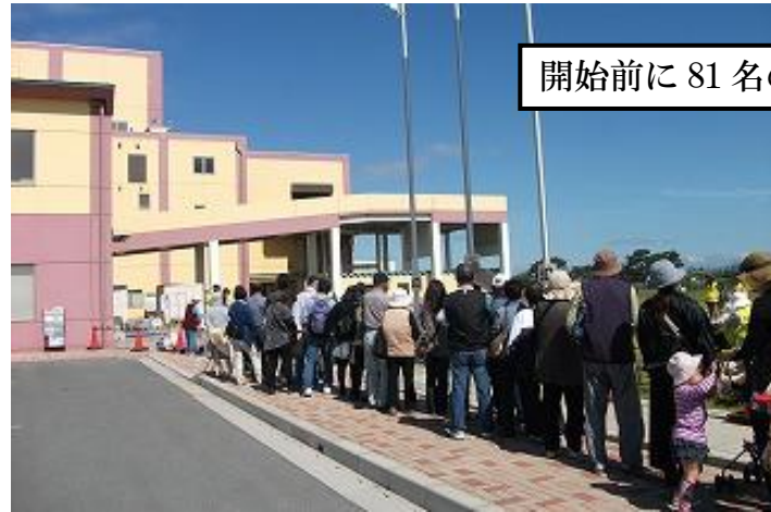
開始前に 81 名の方々が並んでいただきました。

前日の雨も上がり、まぶしいぐらいの中での“もったいない市”となりました。広報はまつ、ぱど、浜松百撰、カリメロ、びぶれ、中日新聞、エコノワ、FM ハロー、あさがお新聞各広報誌広報誌にPR 掲載していただき、過去最高の参加者となりました。