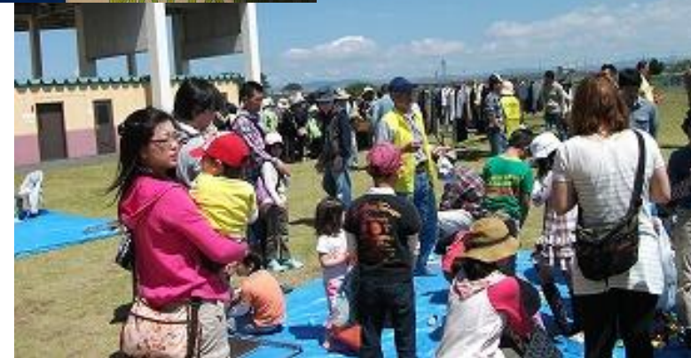
暑さをしのげる休憩スペースを設けました。暑くなる来月の「もったいない市」では、より多くの方が利用していただきたいです。