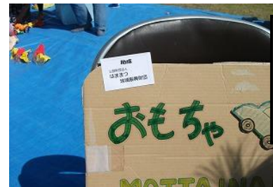
おもちゃコーナーは、いつも子供たちや親たちで一杯です。おもちゃが持込まれると、「欲しい人は手を挙げて」とスタッフが、新たな持主をジャンケンで決めています。度々ジャンケンの掛け声が聞かれます。