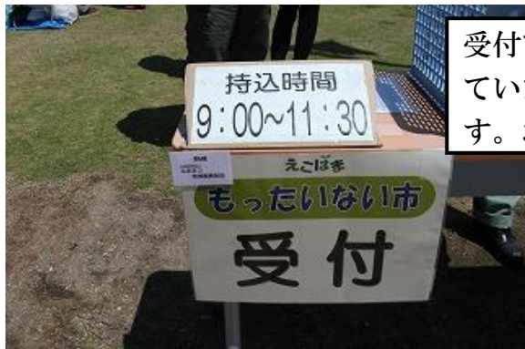
受付では、お持ちいただいた商品が新たな持ち主に気持ち良く使ってもらえるよう、衣類のシミや毛玉などの商品はお返ししています。おもちゃでは作動状況などを確認させていただいています。