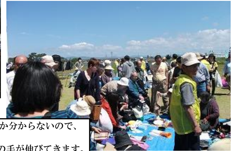
日用品コーナーは、いつ・何が持込まれるのかわからないので、なかなかコーナーから離れられません。新しい物が入れば、あちこちから多くの方の手が伸びてきます。