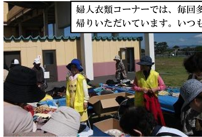
婦人衣類コーナーでは、毎回多くの衣服が持込まれ、ほとんど新たな持ち主にお持ち帰りいただいています。いつも最も賑わうコーナーとなっています。

子供服コーナーもすっかり開場の準備ができました。「お下がり感覚で、次の方に譲っていただけるようきれいに洗濯してきました。」と受付に持参していただきました。これが交換市の嬉しいところです。