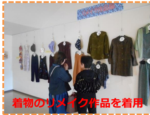
着物のリメイク作品を着用