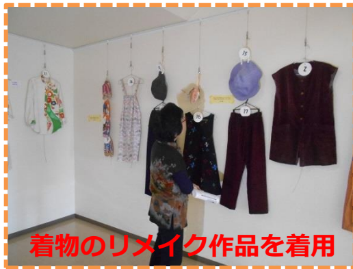
着物のリメイク作品を着用

毎月1回「もったいない」をコンセプトに講座を開催しています。今回、参加者の知恵や工夫をこらした作品を展示。新しい命を得た衣類等から、捨てるのは「もったいない」を見て感じていただきました。見学者の中には、ご自身の作品を着て来場される方など良い刺激にもなったようです。開催の様子は、静岡新聞にて紹介され来場者も増えました。 展示点数：22点