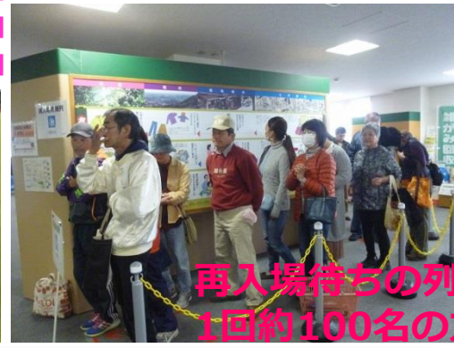
再入場待ちの列。 1回約100名の方が並びました。