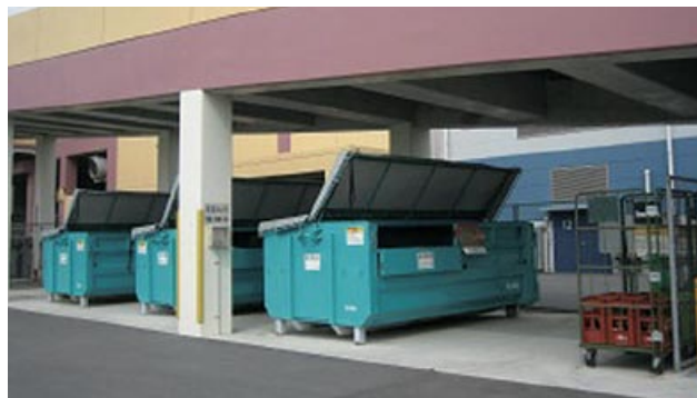
資源物回収集積コーナー※工場棟西側、ランブウェイの下側