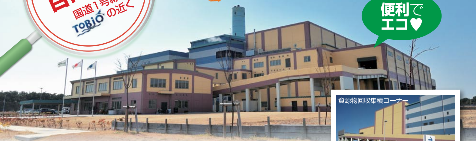
資源物回収集積コーナー